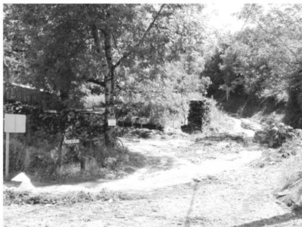
Chemin des Brives au croisement de la nationale