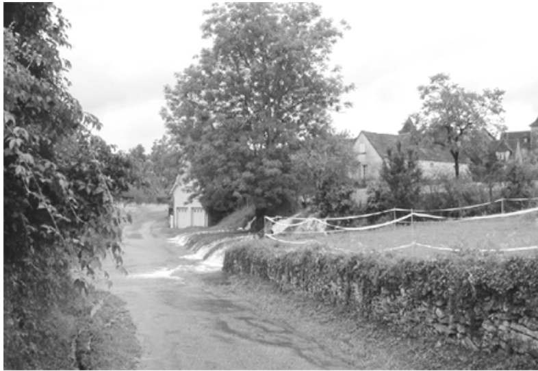
Route menant au pont de chemin de fer du Pech d'Agudes

Le programme ENS (espace naturel sensible) continue, pas toutefois comme nous l'aurions souhaité mais c'est une action du Conseil Général et du Syndicat Mixte et non du Conseil municipal, ce qui explique que nous nous sentions un peu hors-jeu et c'est assurément dommage. C'est ainsi, que le ruisseau de Bascle se trouve débarrassé de tous ses embâcles sans que nous en soyons véritablement informés. Dommage là aussi, mais tant mieux pour les propriétaires à qui cela ne coûte rien.