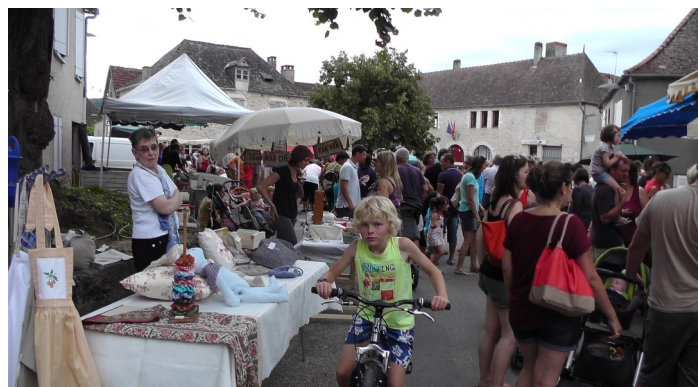
Marché des gourmets sur la place du village